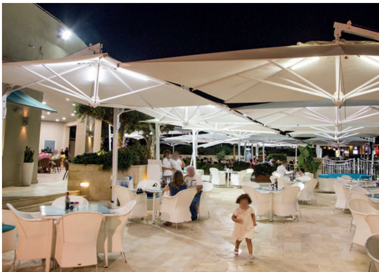
RADISSON HOTEL MALTA